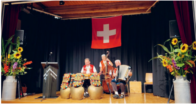
Die Warth-Bueben im Element

Ein grosses DANKESCHÖN an alle Helfer, die diese gelungene 1. Augustfeier möglich gemacht haben.