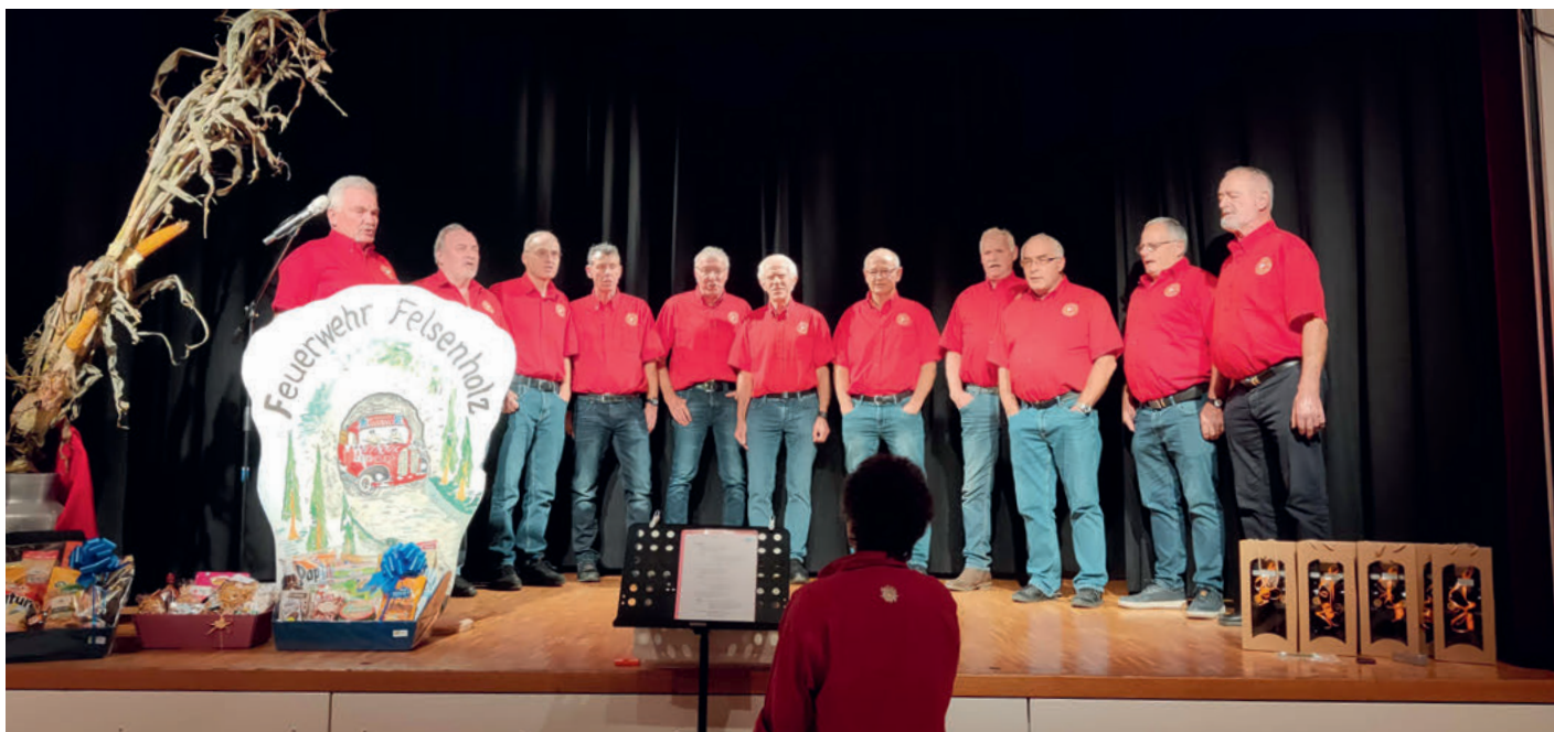
Das Fűrwehrhörli Felsenholz singt und serviert anlässlich des Schlussrapportes 2023